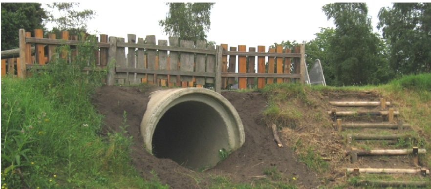
Plaatsing extra hekjes