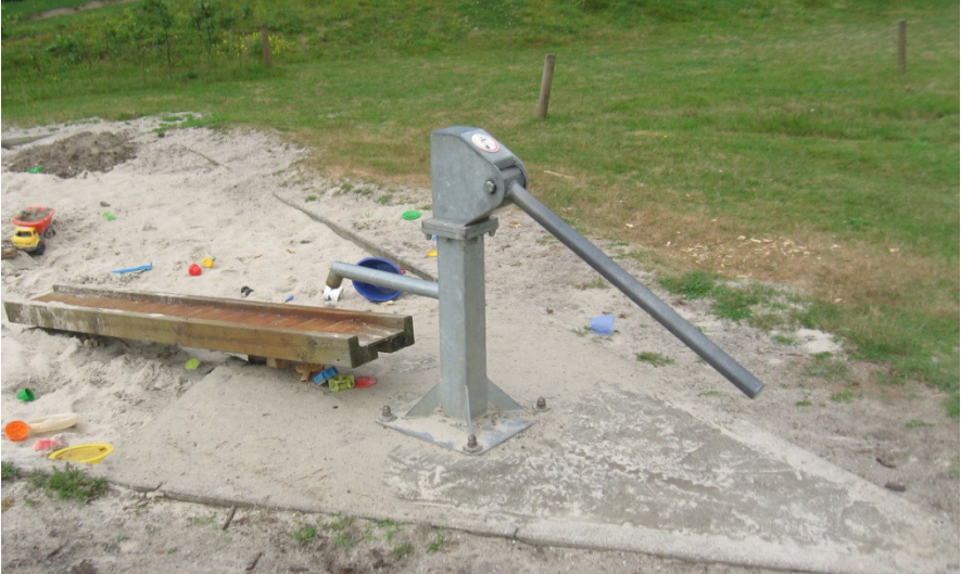
Gerepareerde waterpomp ingegoten in beton