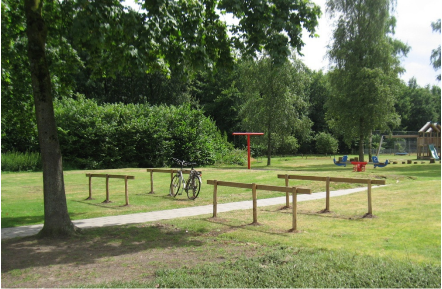
Vier fietsenrekken bij de entree