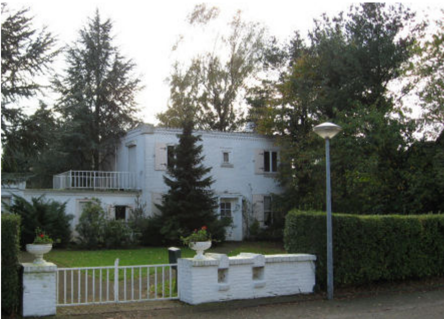
Batalaan 12 (nog) met witte poort

In onze vorige Nieuwsbrief stond vermeld dat de gemeente drie makelaars benaderd heeft met de vraag wie van hun de villa tegen de beste condities in de markt kan zetten. De winnaar zou van de gemeente de opdracht krijgen om later dit jaar de verkoop op te starten. In het ED en ook in GB stond in de maand juli vermeld dat Batalaan 12 voor de gemeente mogelijk in aanmerking kwam voor het huisvesten van statushouders. Deze kwestie is niet meer aan de orde. Per 31 augustus is de verkoop van Batalaan 12 gestart.