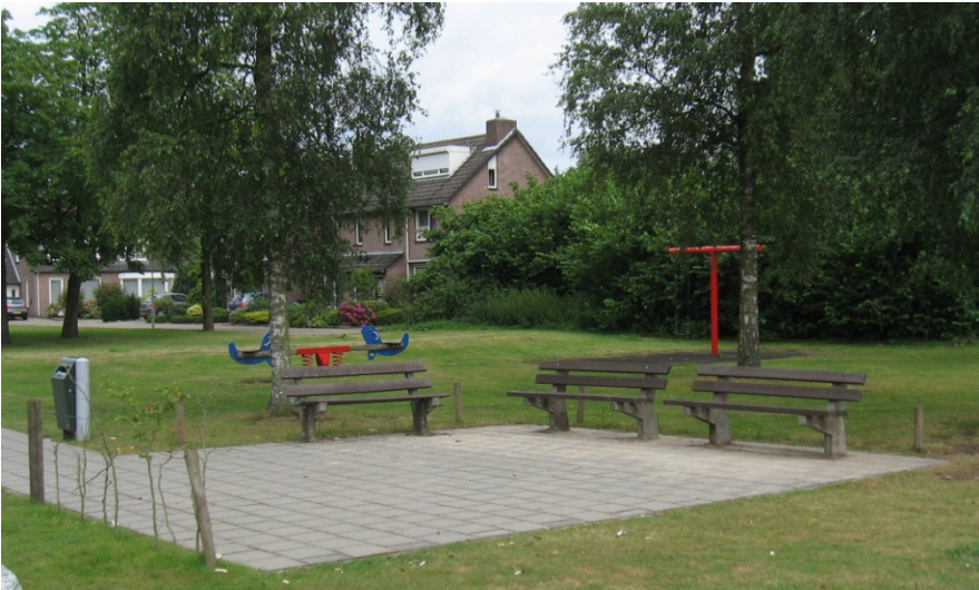
Twee extra bankjes