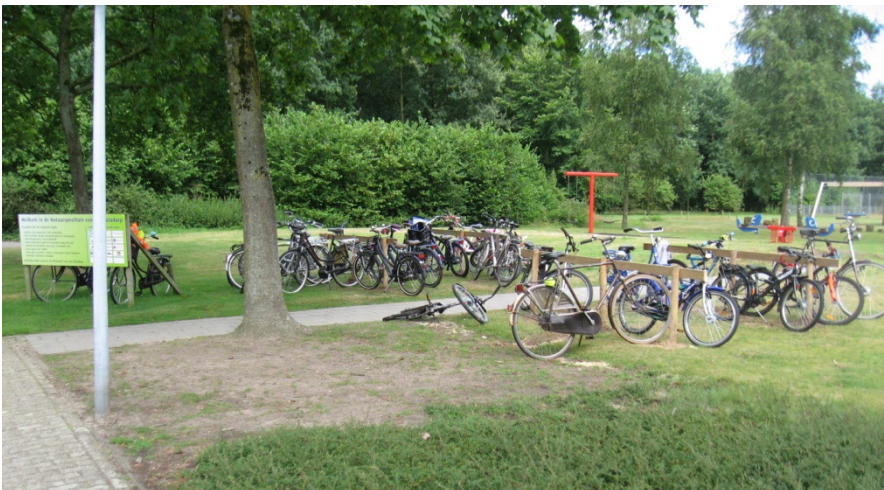
Ingebruikneming fietsenrekken een dag later