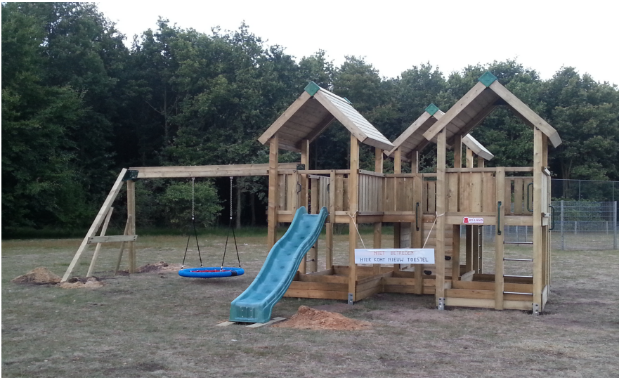
Wicky klimtoestel met nestschommel

Het nieuwe speeltoestel Wickey en de nestschommel, in onze vorige Nieuwsbrief al aangekondigd, is besteld en geplaatst. Zoals te zien op de foto biedt dit nieuwe toestel talloze mogelijkheden voor een aantal kinderen in de leeftijd van 4 tot 12 jaar om er tegelijk op te spelen.