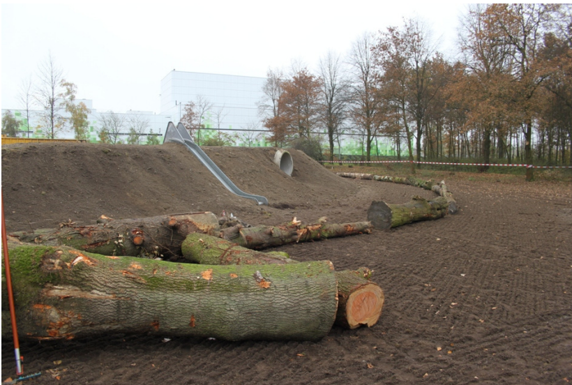
Foto actuele situatie Batabult