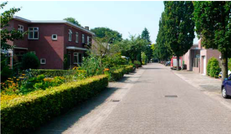
Omslag van 'Concept Beeldkwaliteitsplan Batadorp'