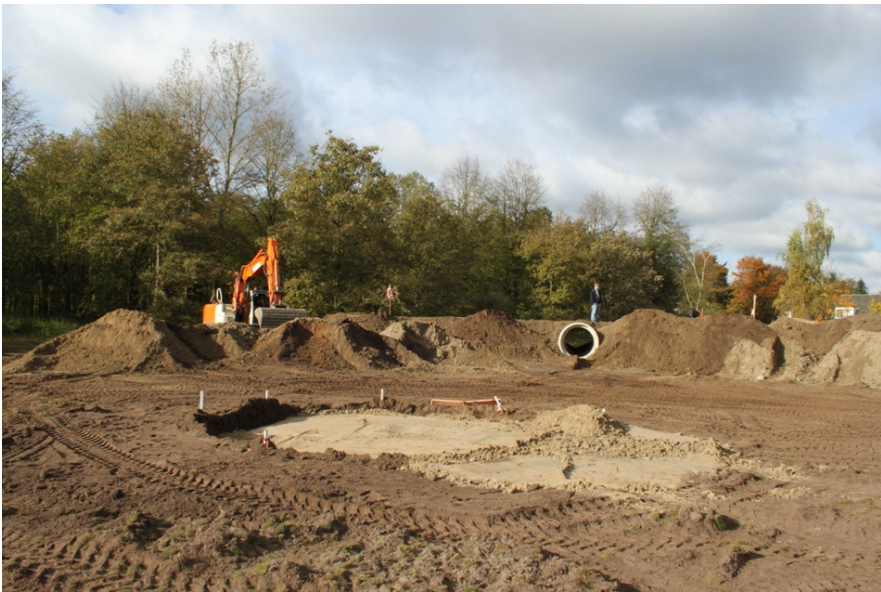
Foto formeren van de Batabult