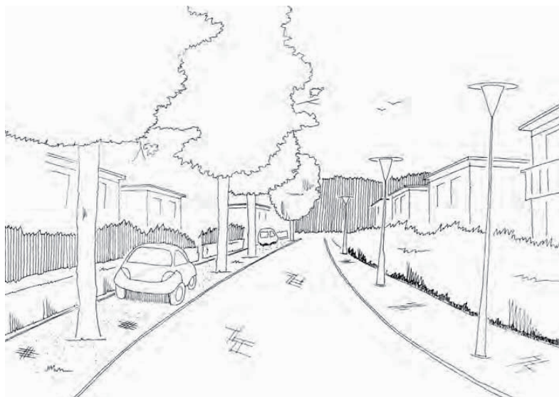
Uit boekje "Batadorp ruimtelijke en cultuurhistorische verkenning" pagina 72

Als bewoner van het Batadorp zal het u niet ontgaan zijn dat er in de afgelopen periode zeer veel, juist over het Batadorp als wijk, te doen is geweest. Het Batadorp wordt voorgedragen om door het Rijk aangewezen te worden als beschermd dorpsgezicht. Naast de huidige 11 Rijksmonument woningen en de 3 Rijksmonument gebouwen kunnen er nog 24 woningen en 1 gebouw als gemeentemonument bijkomen.